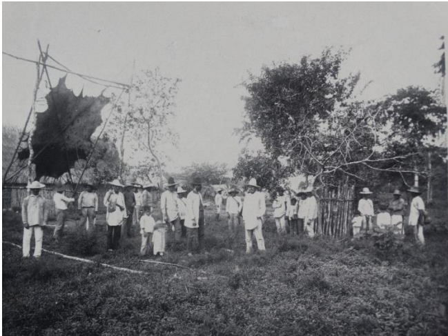
Foto en blanco y negro de un grupo de personas en una granja.